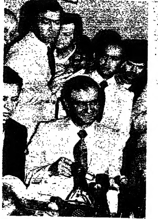
الوزير الاعلام العماد موسى خنمان يتحدث في مؤتمره الصحفي امس ، ويحدد المبرم للمسلمة وزارة الاعلام السيد رامز خنمان وحشد من الصحفيين